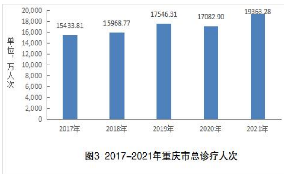
表 5 医疗卫生机构总诊疗人次数