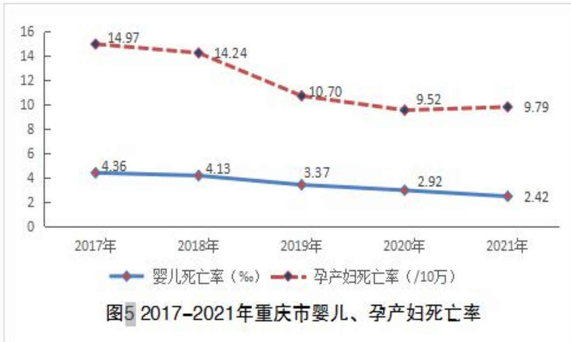
表 23 妇幼卫生情况