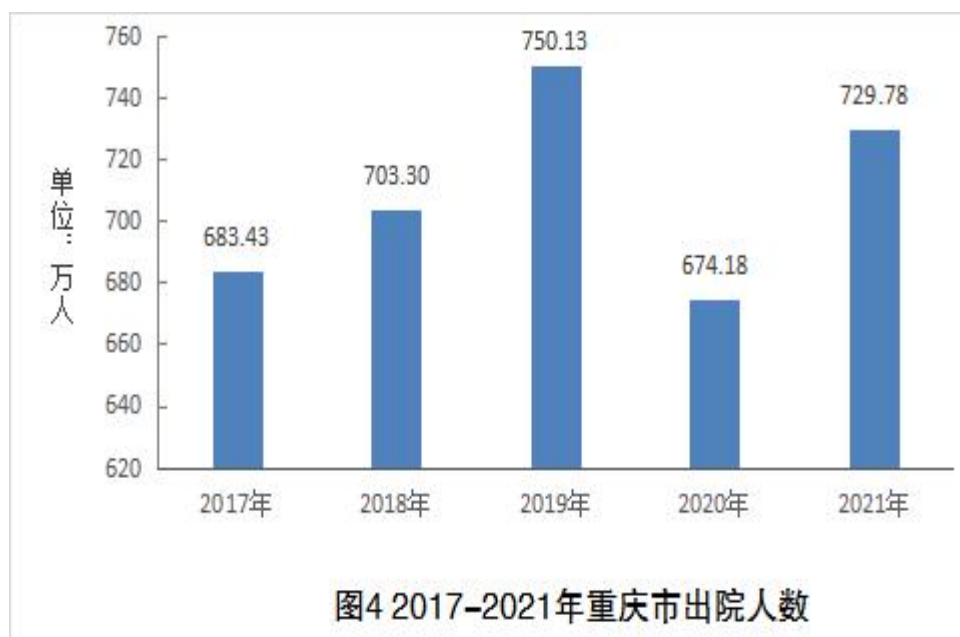
表 6 医疗卫生机构出院人数

增长 4.10%；专业公共卫生机构 21.71 万人，占比 2.97%，同比增长 5.34%。分片区看，都市区、渝东北城镇群和渝东南城镇群的出院人数占比分别为 61.26%、27.49%、11.25%。（见表 6）